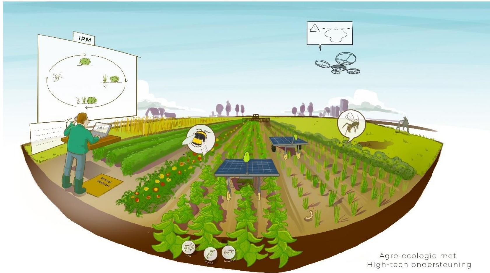
Agro-ecologie met High-tech ondersteuning